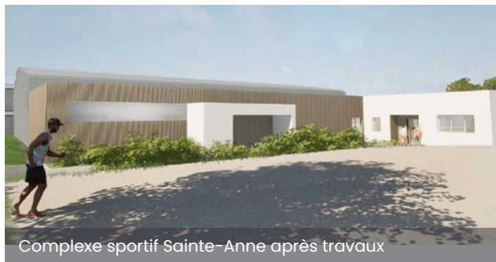
Complexe sportif Sainte-Anne après travaux