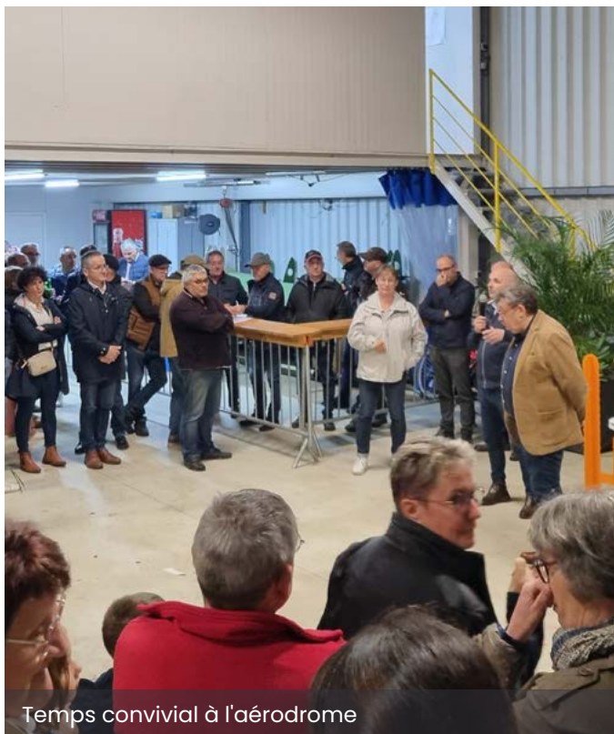
Temps convivial à l'aérodrome