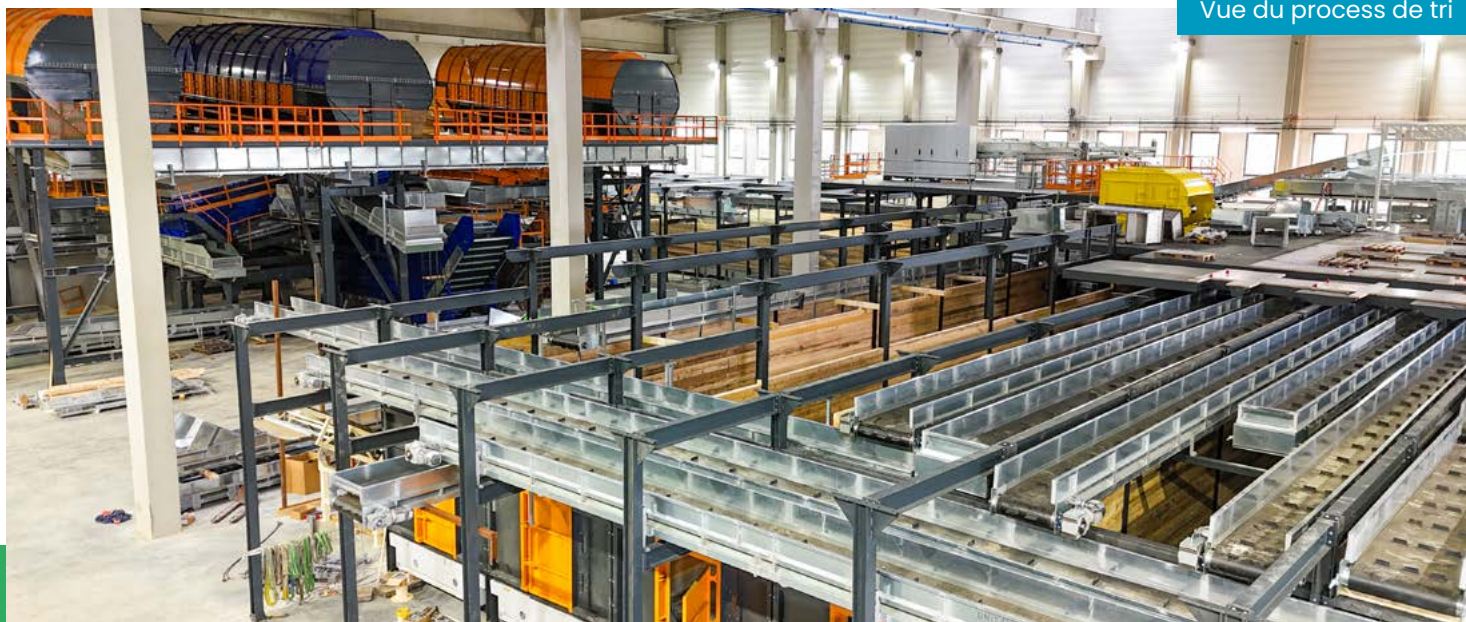
Vue du process de tri

D'ici la fin de l'année 2025, les scolaires pourront découvrir ce bel équipement.