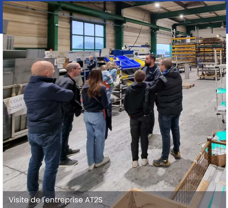
Visite de l'entreprise AT2S

Rendez-vous en 2025, pour les rencontres économiques du Temple et de Mauléon-ville