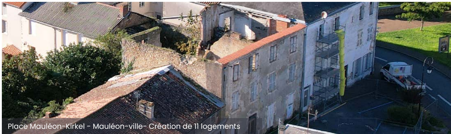
Place Mauléon-Kirkel - Mauléon-ville - Création de 11 logements