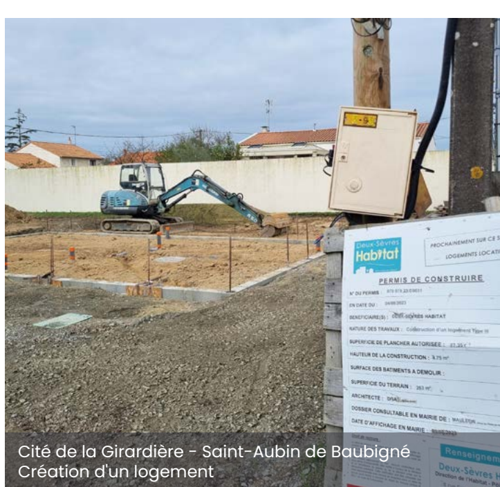
Cité de la Girardière - Saint-Aubin de Baubigné Création d'un logement