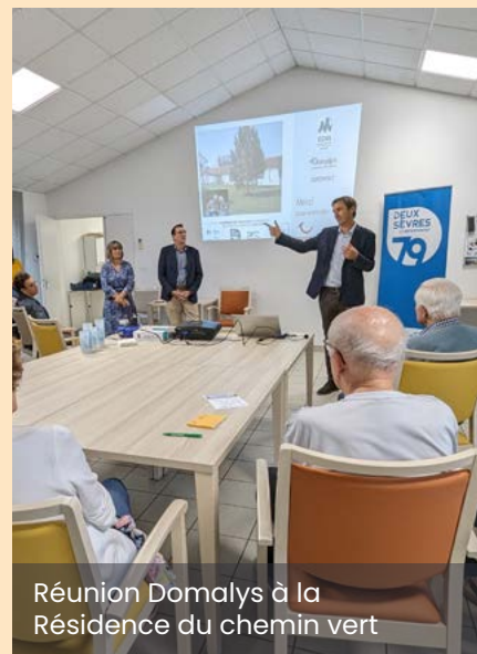
Réunion Domalys à la Résidence du chemin vert