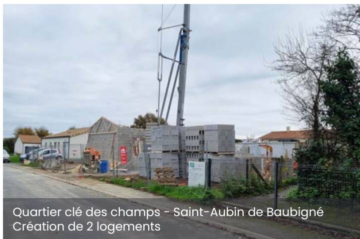
Quartier clé des champs - Saint-Aubin de Baubigné Création de 2 logements