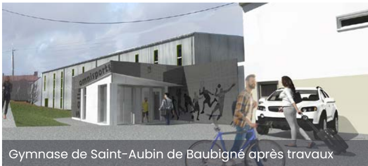
Gymnase de Saint-Aubin de Baubigné après travaux