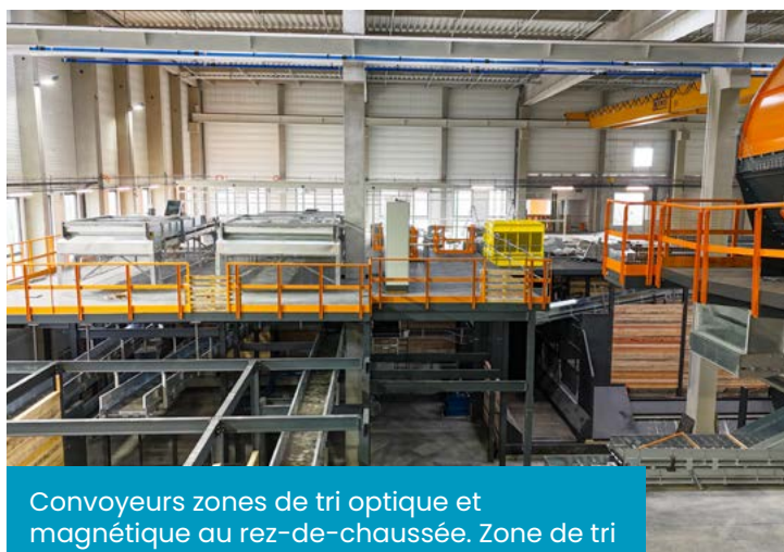
Convoyeurs zones de tri optique et magnétique au rez-de-chaussée. Zone de tri manuel au-dessus

Le bardage, qui assure l'isolation et la protection des bâtiments, est désormais totalement installé. De plus, toutes les portes ont été posées, permettant de mettre à l'abri les matériaux entrants et sortants.