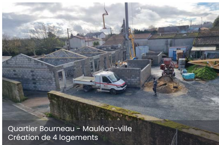
Quartier Bourneau - Mauléon-ville Création de 4 logements