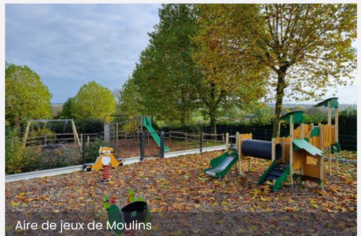
Aire de jeux de Moulins

La 2ème partie de l'aire de jeux, annoncée dans le précédent magazine, s'est achevée avec l'installation d'une balançoire "corbeille".