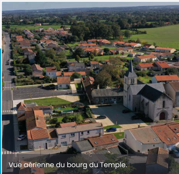
Vue aérienne du bourg du Temple.