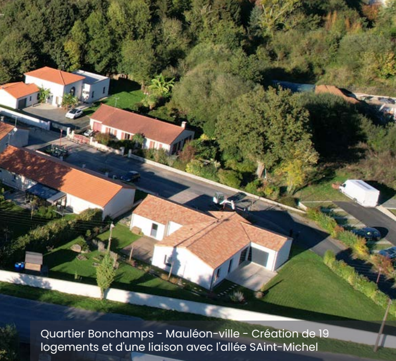
Quartier Bonchamps - Mauléon-ville - Création de 19 logements et d'une liaison avec l'allée Saint-Michel