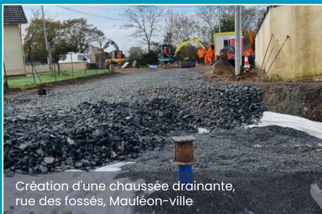
Création d'une chaussée drainante, rue des fossés, Mauléon-ville

A ce titre, la collectivité vient d'achever les travaux de la traversée du bourg du Temple qui ont permis de requalifier la place de la mairie et la place Saint-Sauveur en créant de nombreux espaces végétalisés.