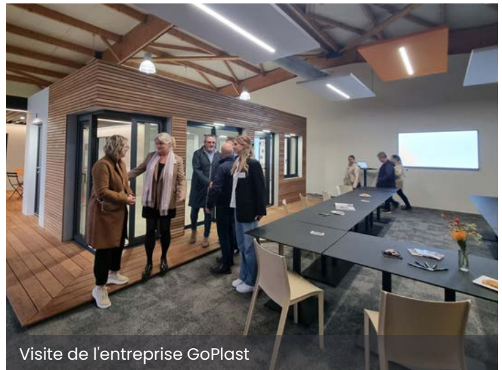
Visite de l'entreprise GoPlast