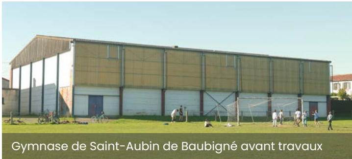
Gymnase de Saint-Aubin de Baubigné avant travaux

La volonté de la commune est de tendre vers un bâtiment ayant le plus faible impact carbone possible et à la gestion la moins coûteuse, tant en terme énergétique que d'entretien. Elle a confié la réalisation des travaux au cabinet d'architecture FRENESIS (85 MAILLEZAIS). Ces derniers devraient débiter d'ici le mois de juin prochain pour une durée de 12 mois.