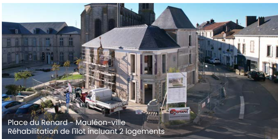
Place du Renard - Mauléon-ville Réhabilitation de l'îlot incluant 2 logements