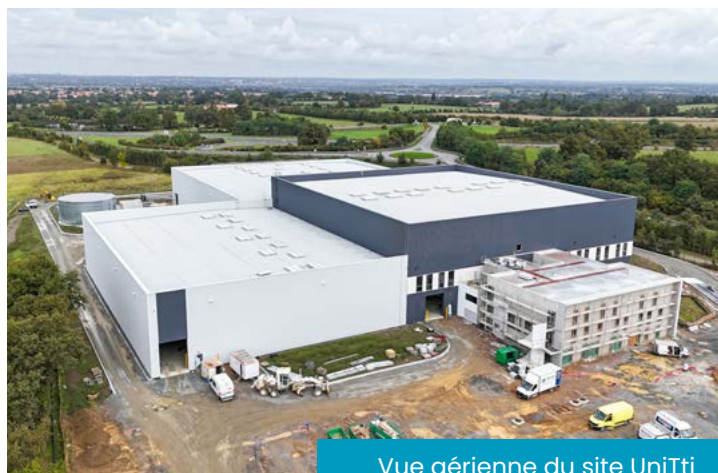
Vue aérienne du site UniTri

L'éclairage est également terminé et les systèmes de sécurité incendie sont en place. Dans le hall de réception, des canons à eau ont été installés, tandis que le hall d'expédition est maintenant équipé d'un système de sprinklage. Ces systèmes sont alimentés par une cuve à eau et une réserve d'eau installées à l'arrière du bâtiment.