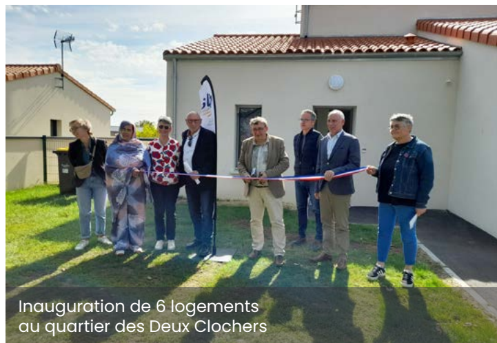
Inauguration de 6 logements au quartier des Deux Clochers

À Saint-Aubin de Baubigné, Deux Sèvres Habitat construit également 3 logements locatifs qui seront livrés d'ici septembre 2025.