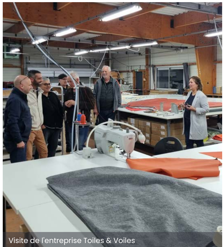
Visite de l'entreprise Toiles & Voiles