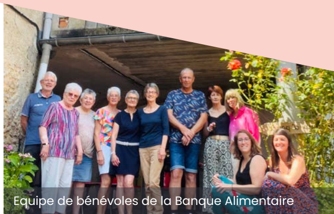
Equipe de bénévoles de la Banque Alimentaire

(veille sociale, actions en faveur des habitants, prévenir les situations d'isolement, partenariat avec les acteurs de la santé, aider à compléter les dossiers de santé...)