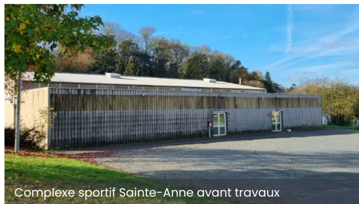
Complexe sportif Sainte-Anne avant travaux

Le chantier devrait démarrer d'ici le mois de février et s'achever à la fin de l'année.