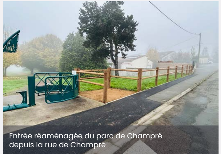
Entrée réaménagée du parc de Champré depuis la rue de Champré

Cette aire de jeux deviendra ainsi un espace de rencontre où la diversité est encouragée par le jeu.