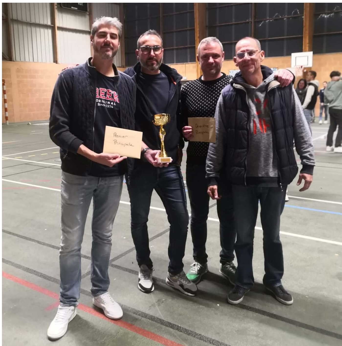
1er et 2ème principale

La 3ème édition du tournoi de palets de Moulins organisée par le comité des fêtes a eu lieu le vendredi 27 Septembre. 56 équipes étaient en lice, soit 8 de plus que l'année dernière. Le tournoi a encore été un grand succès de participation, de convivialité et de sport, il a été remporté par des locaux !