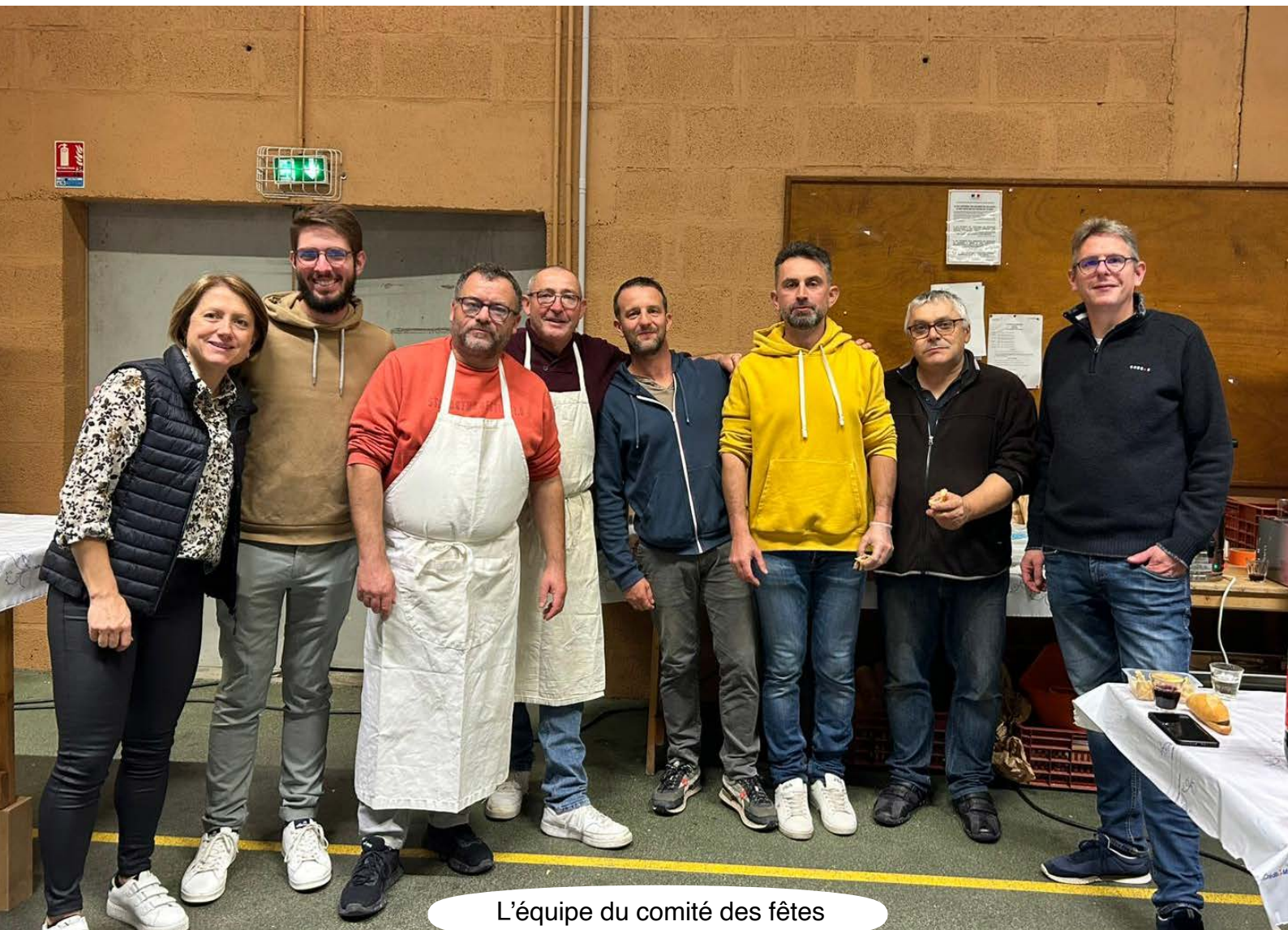
L'équipe du comité des fêtes