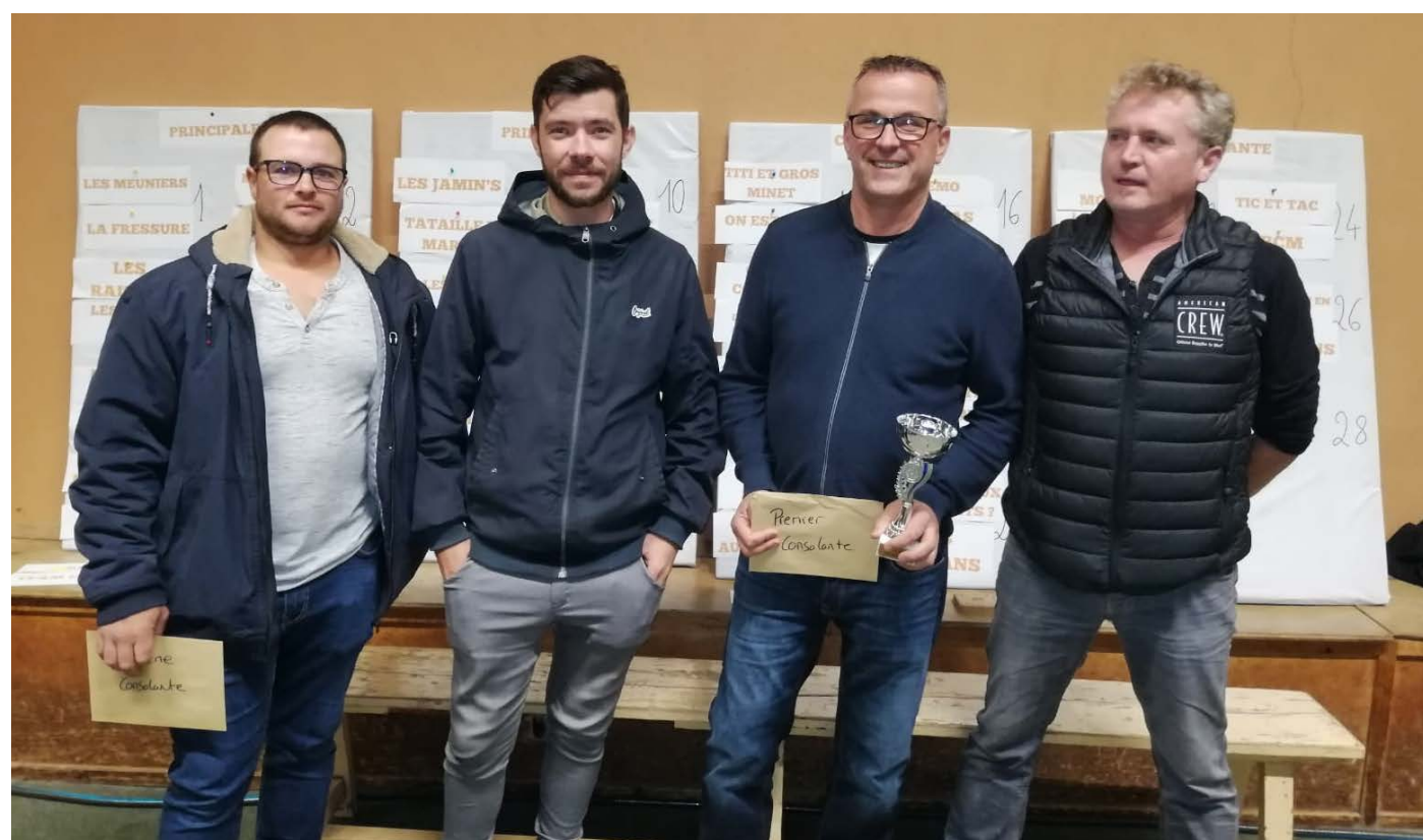
1er et 2ème consolante